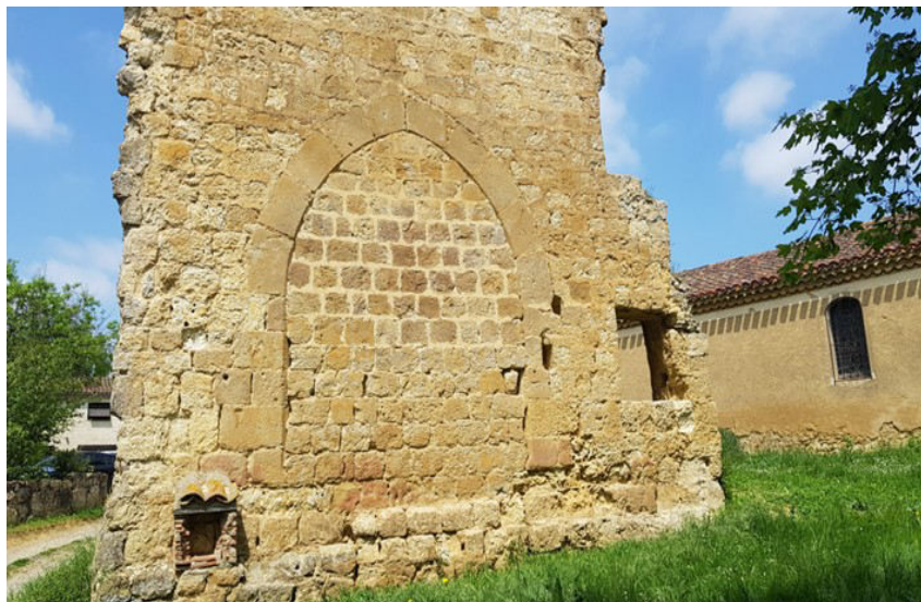
ancienne entrée du village, aujourd'hui murée