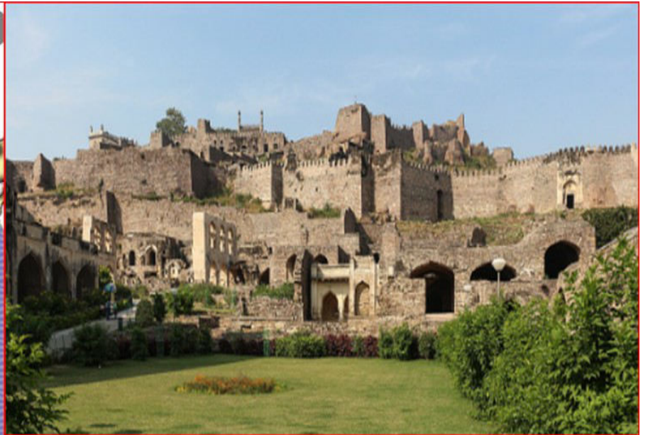
Fort de Golconde

Alix de Selva , A propos du centenaire du décès du compositeur Paul Lacome (Le Houga 1838-1920) célèbre en son temps pour des opéras-comiques, des opérettes etc.