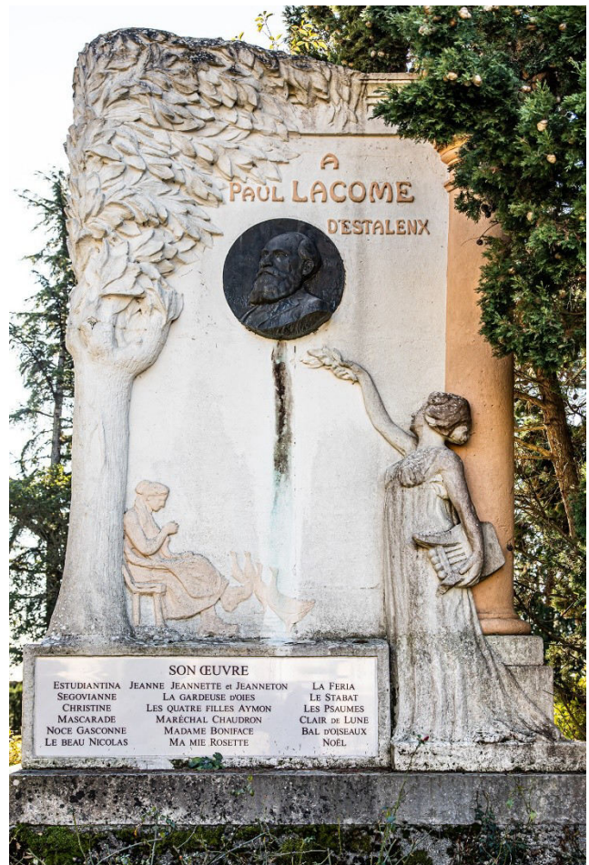
monument à sa mémoire au Houga.