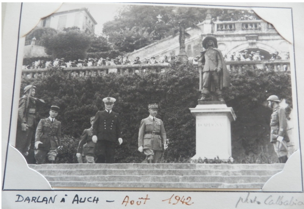
Photo prise le 26 août 1942 à Auch lors de la venue de l'amiral Darlan.

Dans la zone Sud, Vichy organise une grande opération de rafle le 26 août 1942, pour répondre aux accords Oberg-Knochen-Bousquet. Dans le Gers, les préfets de région et de département fixent pour 5h30 l'arrestation de 145 juifs ciblés, venus dans le Gers depuis 1936. Finalement, 116 seront arrêtés, les autres étant absents ou en fuite. 107 furent effectivement déportés à Auschwitz via les convois 28 et 29. Seuls 7 seront vivants en 1945. Peu d'informations filtrent dans la population, mais on peut voir des commentaires surprenants dans des rapports de RG, des réactions opposées dans le clergé gersois. Enfin, s'il n'y a pas eu de photos prises de cette rafle dans la zone Sud, pour Auch, plétore ont été prise ce jour : c'est à cette date que l'amiral Darlan passe par Auch pour installer le nouveau préfet.