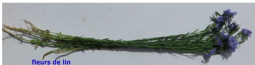
fleurs de lin