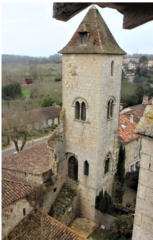
La Romieu, tour du palais d'Arnaud d'Aux

C'est à cette condition que pourra être dressé un portrait fidèle de la production artistique civile de l'époque considérée, qui ne trouve guère de pendant en France que dans le Quercy et dans le milieu avignonnais.