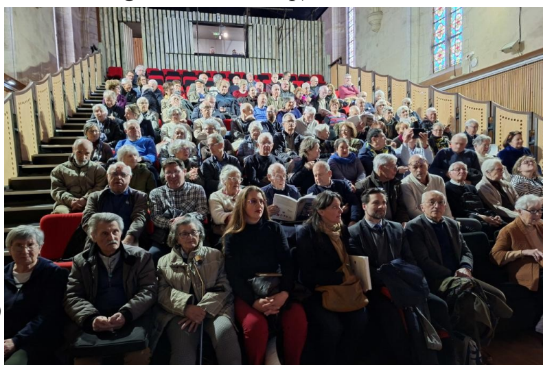
(cl. M-H Rey)