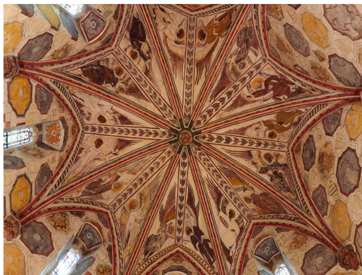
(Voûte du rez-de-chaussée de la tour nord de la collégiale de La Romieu. Anges buccinateurs et thuriféraires)