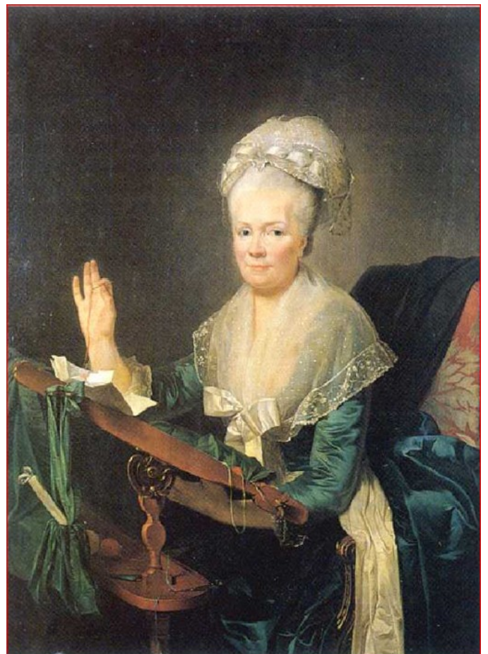
portrait de Mme d'Etigny (collection privée)