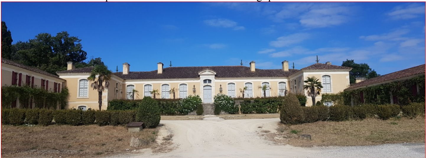
Chartreuse d'Arcamont- XVIIIe s.

Samedi 30 août : belle promenade de la Société Archéologique : nous avons visité :