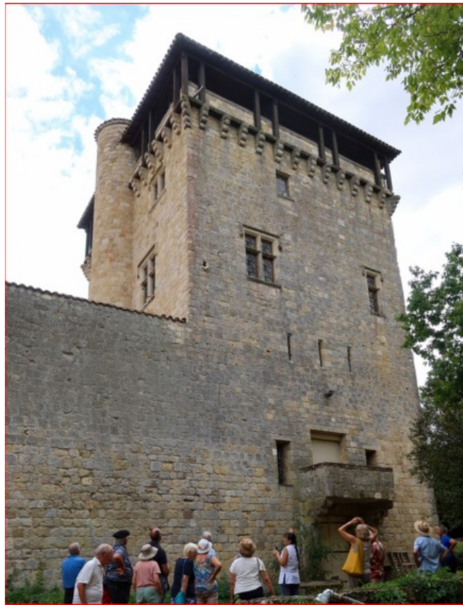
En plusieurs groupes, visite du donjon de Roquefort