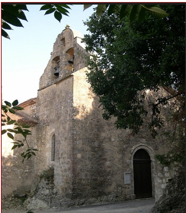
Eglises de Castillon-Massas