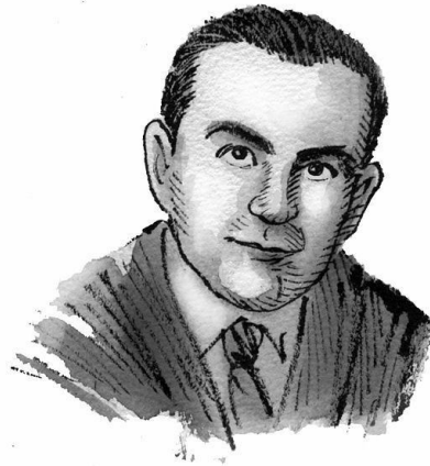
Jean Boudou (dessin de J-C Pertuzé)