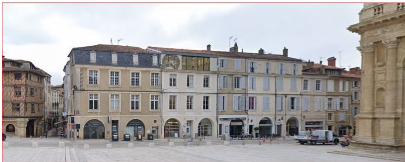
Fig .1 : Façades reconstruites vers 1682-1690 suivant des règles précises avec 2 étages aux fenêtres régulières et aux niveaux soulignés par un bandeau de pierres de taille. Au rez-de-chaussée, succession d'arcades pour les boutiques et de portes surmontées d'un œil-de-bœuf.